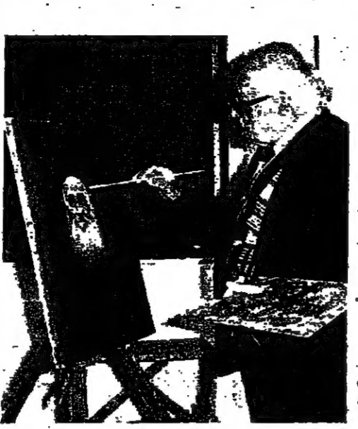
مؤسسة .. تصور مؤرقة على جبل مشرف على منطقة الشمال